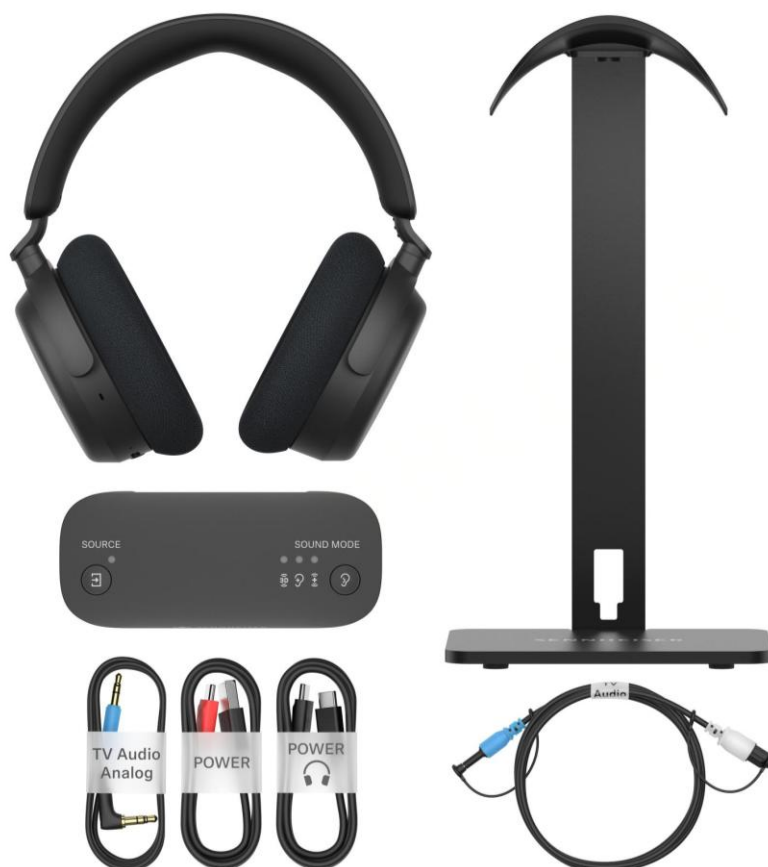
Abbildung: Das RS 275 TV-Kopfhörer-Bundle

Über eine Kombination aus optischem und 3,5-mm-Eingang lässt sich der BTA1 an Fernseher, Stereoanlagen, Laptops, Spielekonsolen und andere Geräte anschließen. Der HDMI-ARC-Eingang erweitert die Möglichkeiten auf Fernseher und A/V-Receiver, die den Anschluss zur Ausgabe von Ton aus integrierten Apps oder Diensten nutzen. Der BTA1 wird über den USB-Typ-A-Anschluss eines nahe gelegenen Geräts (zum Beispiel TV, externer Ladeadapter) mit Strom versorgt und leitet die Energie über einen USB-Typ-C-Anschluss zum Laden des Kopfhörers weiter. Mit seinem schlanken Design passt er perfekt auf den Kopfhörerständer. Bei Bedarf kann er auch diskret in der Nähe der Tonquelle platziert werden.