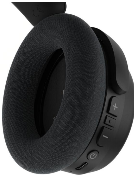
Abbildung: Ultraleichter HDR 275-Kopfhörer mit taktilen Bedienelementen und luxuriösen Ohrpolstern

Sobald der Kopfhörer mit der Smart Control Plus App verbunden ist, können voreingestellte oder benutzerdefinierte Equalizer-Einstellungen, Bassverstärkung und andere Tools zur Klangverbesserung übernommen werden. Nutzer*innen können beispielsweise die Funktion Sprachklarheit auswählen und ihre Präferenzen auf den Gesamtklang des HDR 275 übertragen. Es gibt sogar einen Modus zur Geräuschreduzierung, der laute Hintergrundgeräusche wie Musik in einem Film reduziert und das Signal auf Mono konsolidiert – ideal für ältere Filme und Serien.