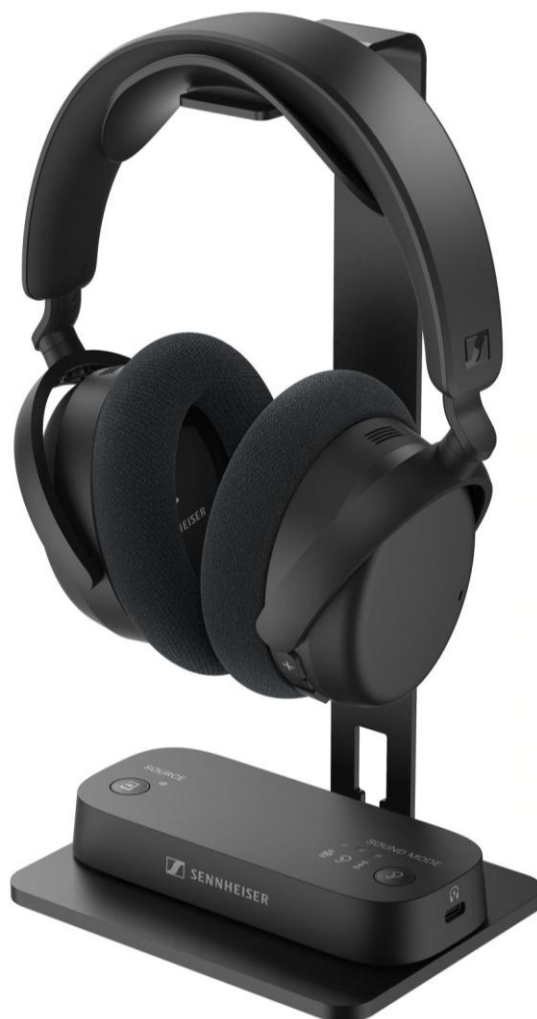
Abbildung: Das RS 275 TV-Kopfhörer-Bundle – HDR 275-Kopfhörer und BTA1-Transmitter